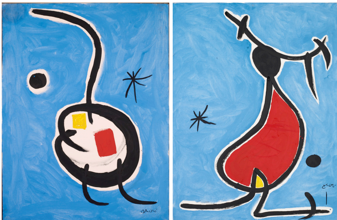
À gauche, Miró, Personnage, étoile , 1978, acrylique sur toile, 116 x 89 cm.